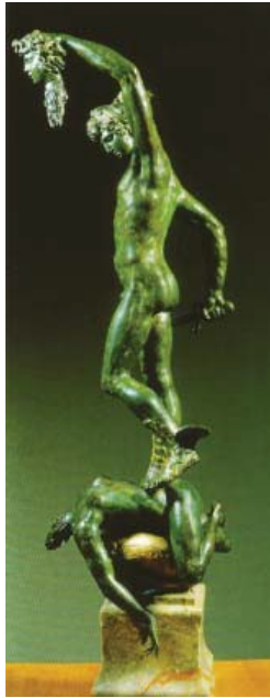
Fig. 4. Benvenuto Cellini (Florence, 1500 – id. 1571), Persée avec la tête de Méduse , 1553, bronze, 320 cm. Florence, loge des lanzi.