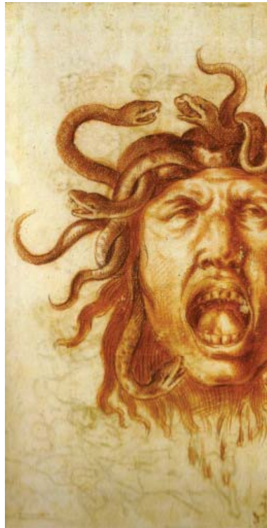
Fig. 2. Atelier de Giacinto Caladrucci (Palerme, 1646 – id. 1707), Tête de Méduse , XVII e siècle, sanguine, 32,2 x 17 cm. Paris, musée du Louvre, département des Arts graphiques.

Choiros , en grec, signifie à la fois la vulve et le cochon : serait-ce donc « ça » que vise Parménide quand il demande au jeune Socrate s'il conçoit une Idée pour « poil, boue, crasse, ou toute chose, la plus dépréciée et la plus vile 2 » ? La laideur absolue du trou originare est associée au postiche phallique dans la figure de Baubô, autre monstruosité antique liée aux mystères d'Eleusis, qu'on rapproche souvent de Méduse, et qui a « réjoui » Déméter en lui dévoilant sa « nature ». Qu'a vu alors Déméter? « Le nom de la femme qui mit fin au deuil de Déméter signifie : la vulve . La plupart des philologues rattache ce mot à Baubon, qui signifie godemiché », précise Georges Devereux 3 . Baubô – la castration compensée par un simulacre phallique? Ou, au contraire, le simulacre phallique révélant le pouvoir abject, non encore apparent, de la Mère détentrice de la vie pour la mort, antérieurement à toute capacité de représentation?