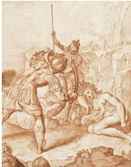
Fig. 5. Pierre Brébiette (Mantes, vers 1598 – Paris, 1650), Persée décapitant Méduse avec l'aide de Minerve , 1633-1638, sanguine, 23,6 x 18,9 cm. Paris, musée du Louvre, département des Arts graphiques.