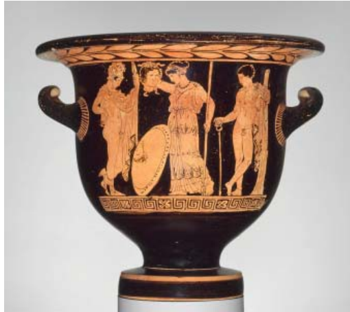
Fig. 1. Peintre de Tarpoley, Cratère apulien , IV e siècle av. J.-C., céramique, 20,3 cm. Boston, musée des Beaux-Arts.

Méduse-Gorgone ne devient donc supportable qu'en tant qu' eikôn . Coupez la tête du monstre et proposez son reflet à la vue : ce n'est qu'ainsi que vous serez protégés de la mort et du sexe féminin qui pourraient vous y absorber. Réfléchissez le monstre par l'intermédiaire de la sagesse, et la vie vous sera garantie ... par l'image, en somme. Serait-ce là la voie du salut ? On peut le supposer. Une tradition tardive évoque Persée comme fondateur de la ville phrygienne au nom explicite d'Iconion, ou Eikonion, qu'un poète tardif désigne comme « fabrique d'images de Gorgô » ( eikasteria gorgous ) : images représentant Gorgô ou images réalisées par Gorgô ? On ne peut que suivre Françoise Frontisi-Ducroux lorsqu'elle affirme avec force « le statut nécessairement iconique de la face de Gorgô [comme] vision interdite qui n'est accessible aux humains que sous forme d' eikôn 1 ».